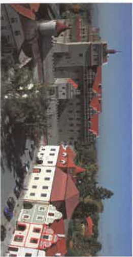
CASTLE AND CHATEAU HORŠOVSKÝ TÝN The chateau is landmark of the town. Under its decorated Renaissance appearance the walls of the early Gothic bishop's castle are hidden. The tower by the palace includes an old chapel. From the old castle only the cellars and one storey of the palace were preserved. Under the Lobkovic's the building was changed into a splendid Renaissance chateau with preserved wall paintings and outer fortifications. The chateau was preserved in this appearance until today and is open to public. There are routes: CASTLE, CHATEAU, KITCHEN, WARDEN'S HOUSE (Town museum) and MITSUKO.