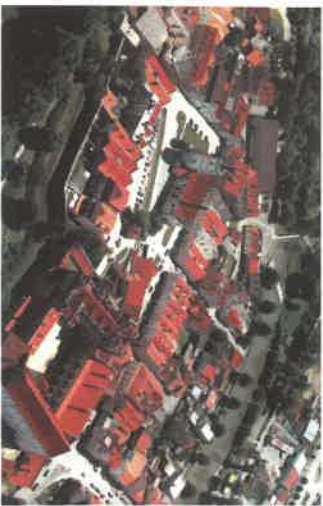
Horšovský Týn is a well-preserved historic town. Here you can see the development of architecture and culture from the early Gothic style up to late Baroque.