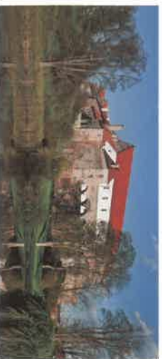
CASTLE PARK HORŠOVSKÝ TÝN The landscape park belongs to the castle. With its area of ha and a lot of rare trees and bushes it belongs

to the most important parks in West Bohemia. Go for a short walk through the park and see some interesting buildings: a Baroque granary, a „window's house, a look-out tower, a loreto (Bohemia's oldest one) or a ballgame-room.